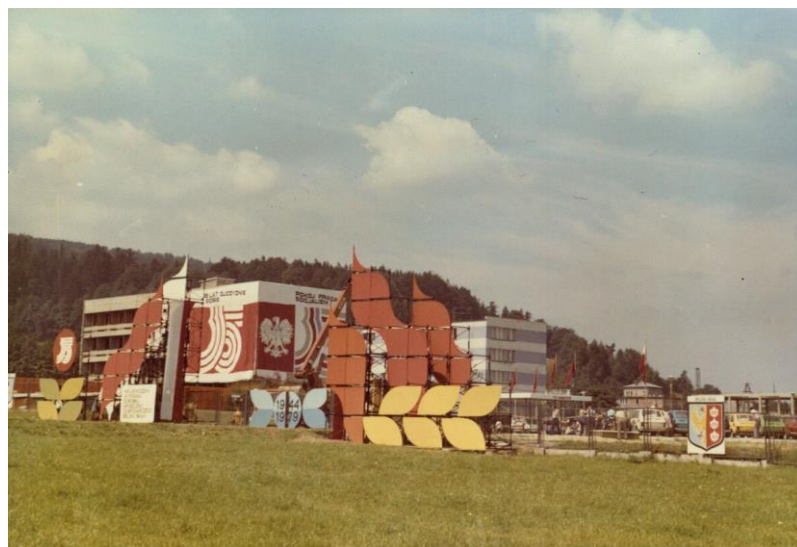
Wojewódzka Wystawa Rozwoju Społeczno-Gospodarczego odbywająca się na terenach ZIAD-u od 15 lipca do 15 września 1979 r.

Opracowanie (styczeń 2024 r.) – Ryszard Migdalski