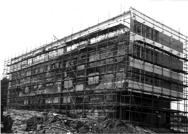
Hotel Ośrodka w budowie - rok 1973